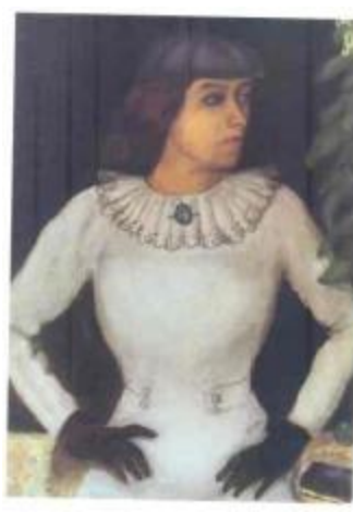
戴黑手套的未婚妻